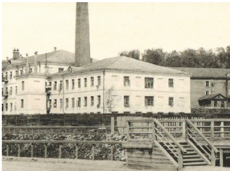
Рисунок 3. Фабрика Котовых. Фото начала XX века.

Уже были переобустроены фабричные корпуса (рис. 3), открыто общежитие для персонала, проведены вентиляция, водопровод и даже центральное отопление, что позволило Н. Н. Баженову с гордостью писать, что теперь «Преображенская больница располагает таким помещением для прислуги, которым могут похвастаться редкие русские, да и далеко не все западноевропейские больничные учреждения» [10].